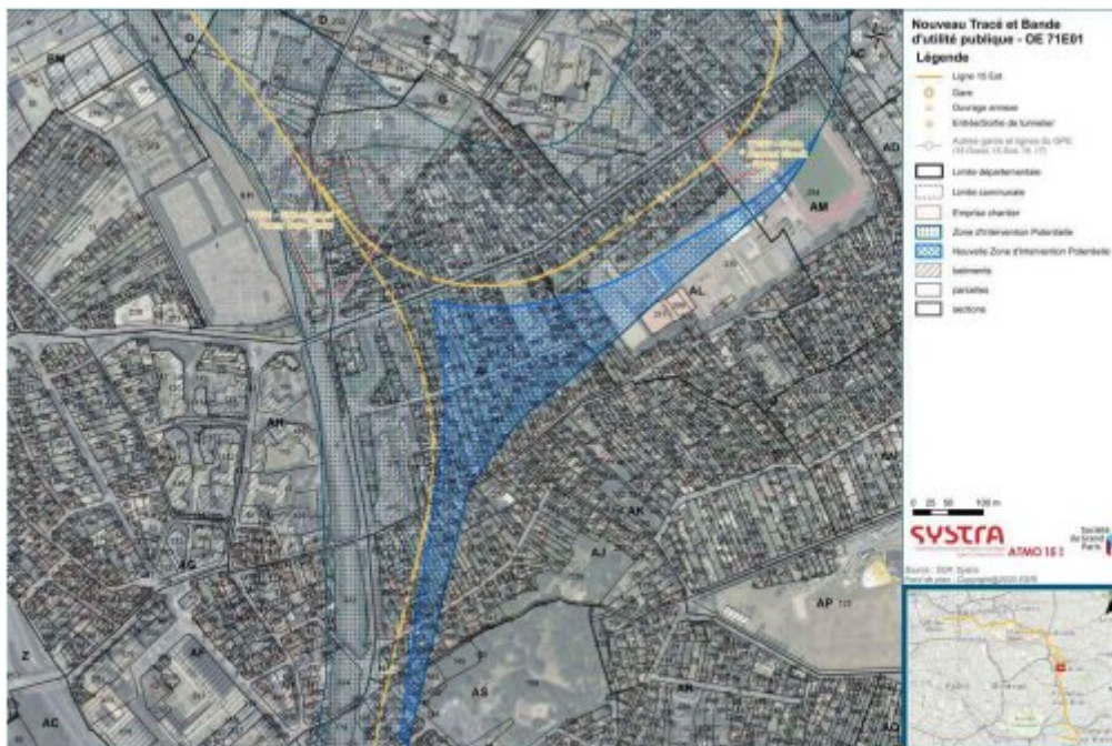
Figure 2 : Évolution de la zone potentielle d'intervention dans le secteur de l'entonnement de Rosny-Bois-Perrier

Dans cet avis, l'Ae considère que la principale modification du projet concerne celle de l'entonnement de Rosny-Bois-Perrier, à la hauteur du débranchement de la ligne principale vers le centre d'exploitation de Rosny-sous-Bois. Les travaux en surface requièrent des emprises décalées vers le sud.